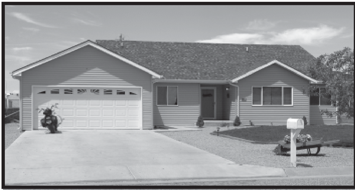
Una casa que fue obtenida por medio de este programa en Ordway, Colorado

Esta oportunidad deja que los prestamistas hagan préstamos a personas quienes, por lo regular, no podrían ayudar. Los préstamos garantizados para la vivienda están disponibles a los solicitantes quienes tienen ingresos que son bajos del 115% de los ingresos medianos del área. Además, la deuda total del solicitante no puede constituir más que el 41% de su ingreso bruto mensual. No se requiere un pago inicial y no hay límites de hipoteca. Los préstamos son pagados por 30 años con un tipo de interés fijo que es determinado por un acuerdo entre el prestamista y el solicitante.