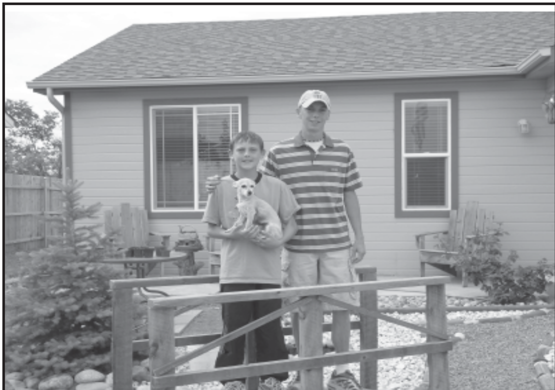
(una familia que participó en este programa en Cañón City, Colorado)

Muchas familias rurales logran el sueño Americano de tener su propia casa por medio del programa de vivienda de autoayuda mutua . Bajo este programa, las familias trabajan juntos para construir un grupo de casas, proveyendo una porción sustancial de la labor que requiere el proceso de la construcción. Esta contribución de “capital laboral” reduce el costo de comprar una casa. Al terminar la construcción, las familias tendrán un promedio de $15.000 a $20.000 del valor líquido de su casa. Bajo este programa, la agencia del desarrollo rural da fondos para financiar la construcción y provee a las familias un Direct Home Loan (préstamo directo para una casa) al terminar la construcción de la casa. Este programa no está disponible en todas las áreas. Favor de contactar a la oficina regional más cercana para averiguar dónde se están planeados los proyectos de construcción de autoayuda mutua.